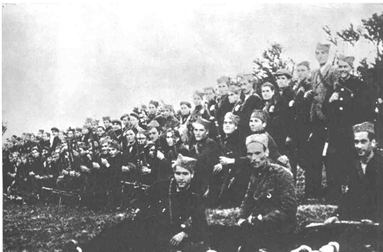
JABLANICKI NOP ODRED S JESENI 1941. GODINE