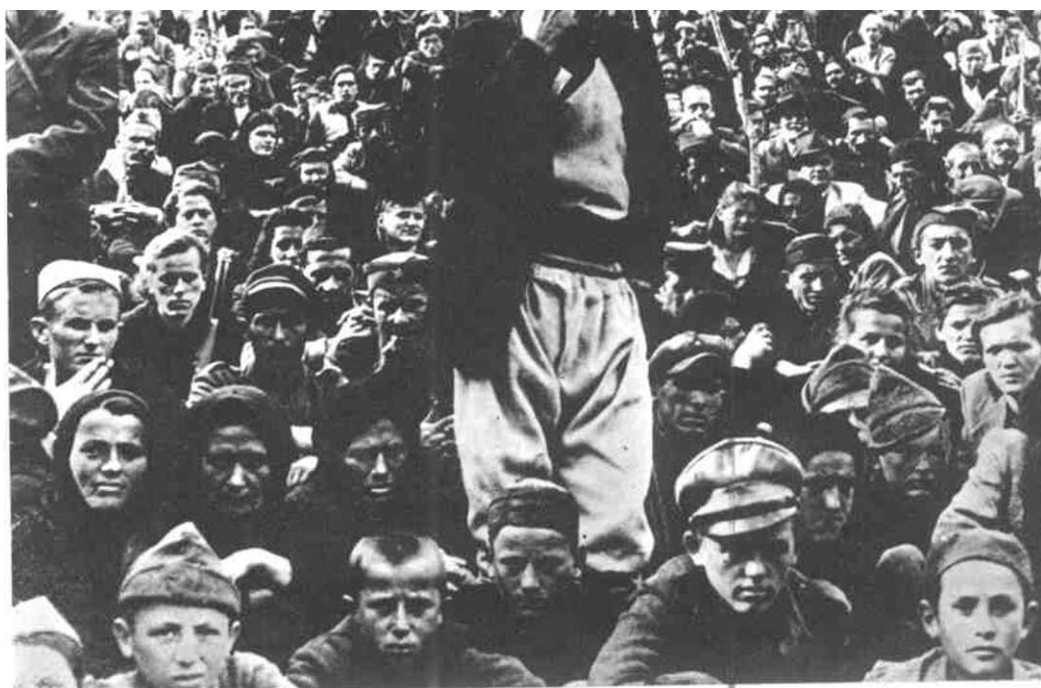
SA NARODNOG ZBORA U OSLOBOĐENIM BI RA NAMA (SADA IVANGRADI OKTOBRA 1943. GODIM